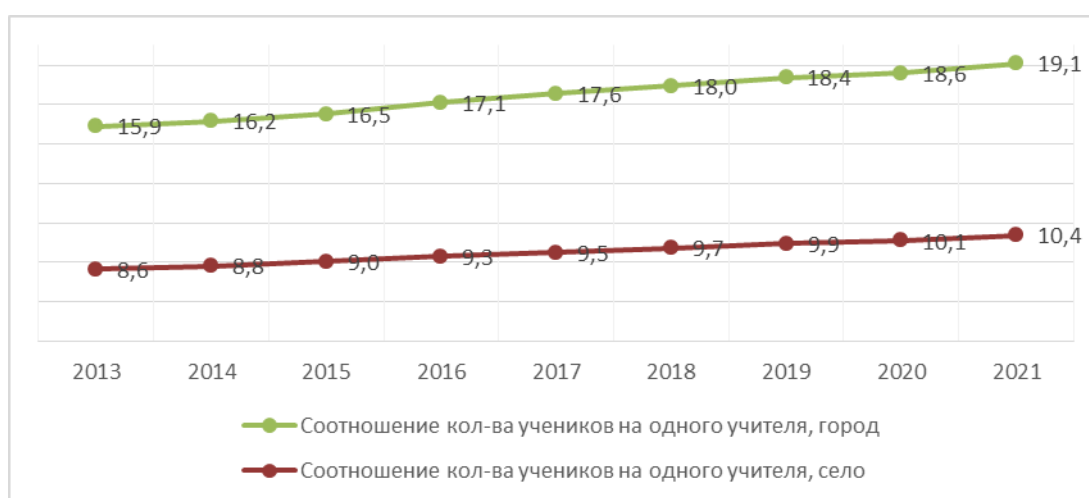
Рис. Динамика соотношения численности обучающихся в расчете на одного учителя (без учета совместителей) в среднем по РФ, в городской и сельской местности, человек.

Рост нагрузки проявляется не только в увеличении количества проводимых учителем уроков, но и в таких показателях, как наполняемость классов и количество обучающихся в расчете на 1 учителя. На начало 2021/2022 учебного года наполняемость классов городских школ составила 26,8 человек, сельских – 14,0 человек. По количеству обучающихся в расчете на 1 учителя: 19,1 – в городских школах и 10,4 – в сельских. Во многом это увеличение связано и с реализуемой кадровой политикой, ориентированной на повышение среднего уровня заработной платы учителей за счет повышения их нагрузки.